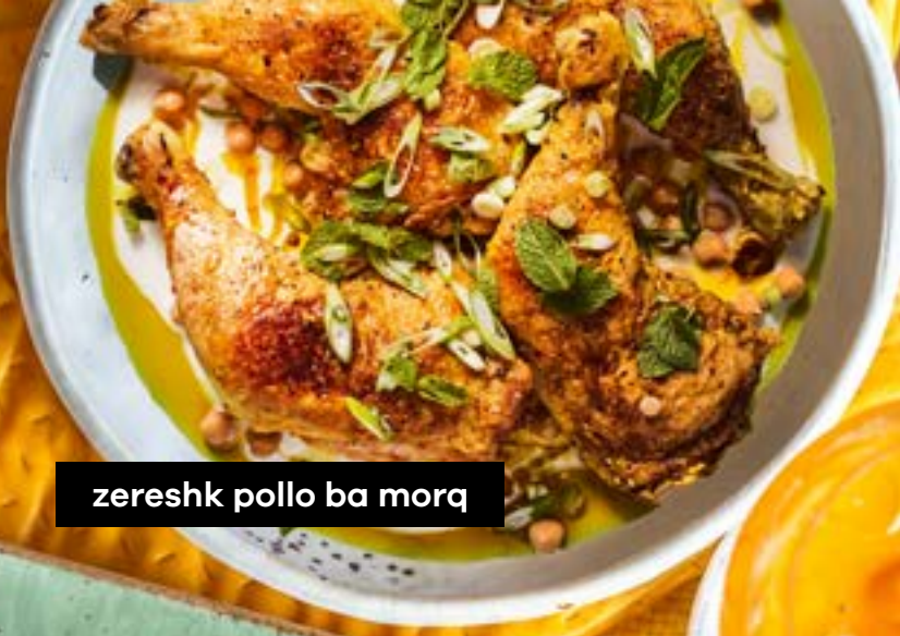
zereshk pollo ba morq